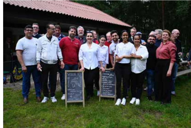
Kookclub iedereen aan Boord ◀