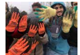
Moestuin iedereen aan Boord ◀ ▲