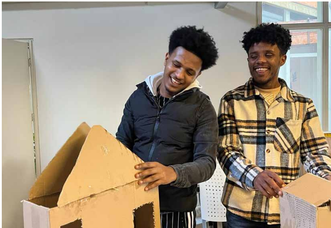
Hanibal en Ahmedin (Eritrea) ▼

Tegenwoordig stemmen de inburgeringsconsulenten en wij gelukkig steeds beter met elkaar af. Daardoor kunnen leerlingen op een goede manier uitstromen en aan de slag bij de taalscholen.