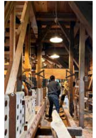
▲ Werken in de Bolwerksmolen