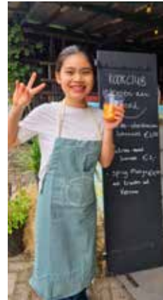
Kookclub iedereen aan Boord ►